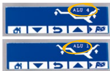
Programmi ALU ALU programs