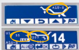
Programmi ALU S ALU S programs

Calibro per misurazione automatica distanza e diametro. Programma ALU S automatico.