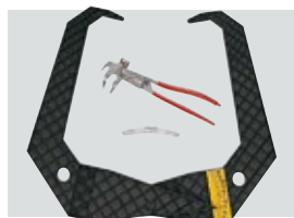
GAR 111 (Ø 44-112 mm)